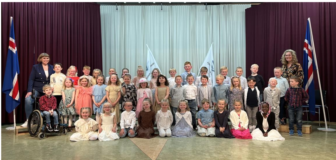
Útskriftahópur vor 2022 árgangur 2016.

Breytingar sem gerðar voru í kjölfar þróunarvinnu eru í stöðugri endurskoðun með þeim sem vinna verkið, þannig grípum við inn í jafnóðum og höldum starfsgleðinni lifandi. Hver og einn skiptir máli.