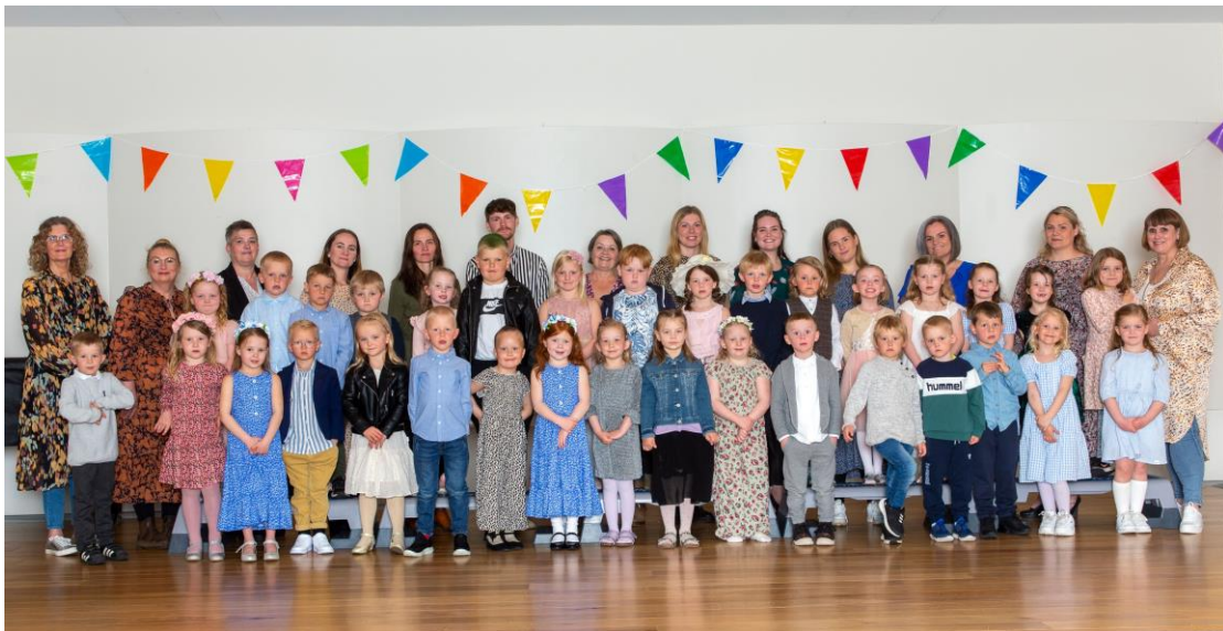
Útskriftahópur vor 2021 árgangur 2015.

*sjá fylgiskjöl : niðurstöður úr starfsmannasamtali